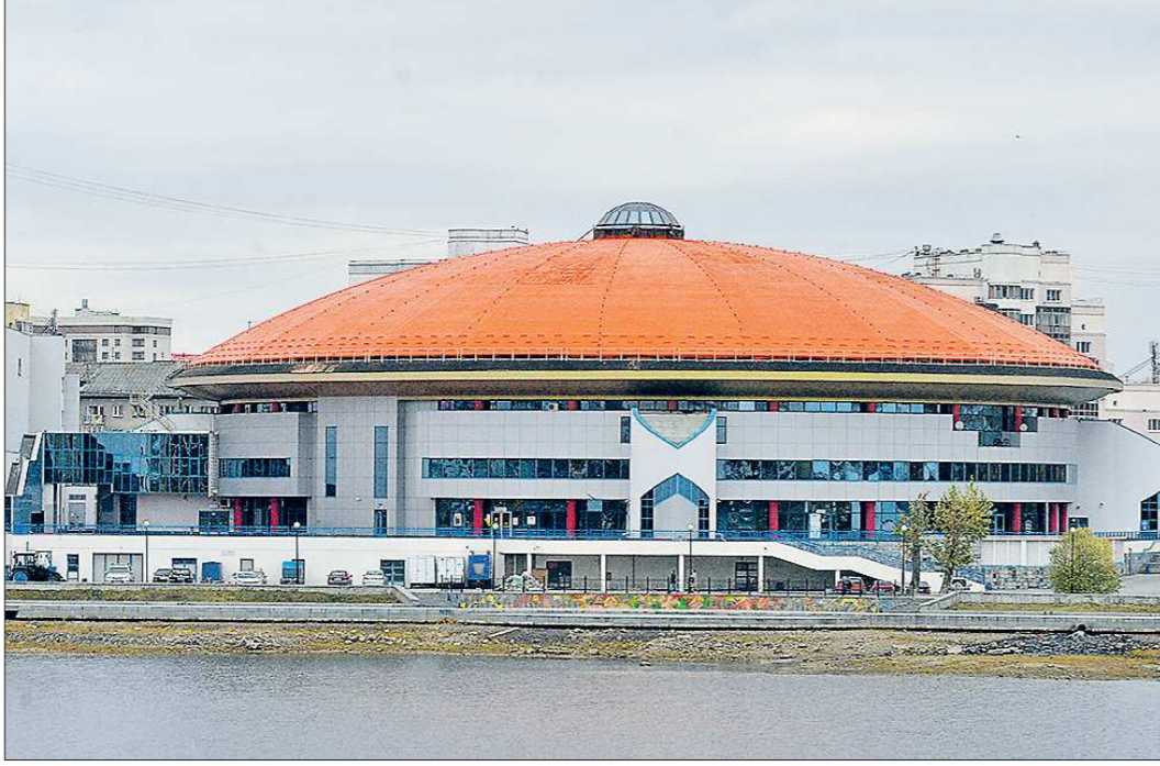
Трижды подряд в 2004-2006 годах ДИВС «Уралочка» признавался лучшим спортивным сооружением России

— У меня был большой опыт руководства спортивными объектами в Сухом Логе, а в Екатеринбурге я появился в 1998 году, став депутатом Областной думы Законодательного собрания Свердловской области. Однажды, когда уже шли последние месяцы моей депутатской деятельности (Полномочия этого созыва истекли в апреле 2002 года. — Прим. «ОГ»), меня пригласил тогдашний губернатор Эдуард Эрзартович Россель и предложил курировать строительство нового Дворца спорта, а затем его возглавить. Сказал, что из двенадцати кандидатов в итоге выбрали меня. Я попросил пару дней на размышление. Передо мной стоял вопрос: оставаться после окончания депутатских полномочий в Екатеринбурге или возвращаться на мою малую родину — в Сухой Лог, который я очень люблю? Решил, что задача построить такой спорткомплекс и с нуля создать коллектив стоит того, чтобы за неё ввязаться. Сложности я понимал, но после четырёх лет