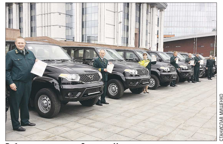
Работники лесничества Среднего Урала рады новым машинам. Теперь лесники ждут дальнейшего обновления автопарка патрульной и пожарной техники

На территории Свердловской области в прошлом году была заложена первая плантация по выращиванию белых грибов в естественных условиях. Мицелий гриба распространили на двух с половиной гектарах леса. На реализацию проекта инвестор потратил шесть миллионов рублей, первую продукцию рассчитывает получить в будущем году. По понятным причинам местонахождение плантации держится в секрете. Подобного рода грибные питомники уже есть в Европе, но там этот бизнес ограничен скудостью лесов. У нас он может быть весьма перспективным.