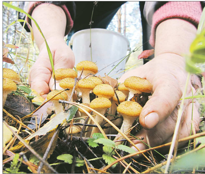
Грибы остаются одним из самых хорошо продаваемых лесных продуктов на рынке