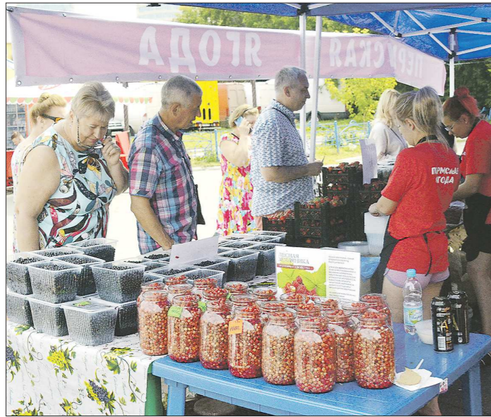
Лесные ягоды – товар скоропортящийся, поэтому их стараются продать как можно быстрее

Но в комментарии «Российской газете» Минсельхоз РФ пояснил, что предлагается лишь «повысить качество и эффективность нормативно-правового регулирования в этой сфере и обеспечить доступ предпринимателям заготовки, переработки и хранения дикоросов к действующим мерам господдержки». Каких-либо ограничительных и контрольных мер по отношению к сбору дикоросов предпринимателями и гражданами ведомство точно не планирует. Главное – нарастить экспорт продукции АПК за счёт реализации лесных ягод, грибов и орехов. И это на самом деле реально: по оценкам министерства, Россия обладает запасами дикорастущего сырья на уровне порядка 8,5 милли-