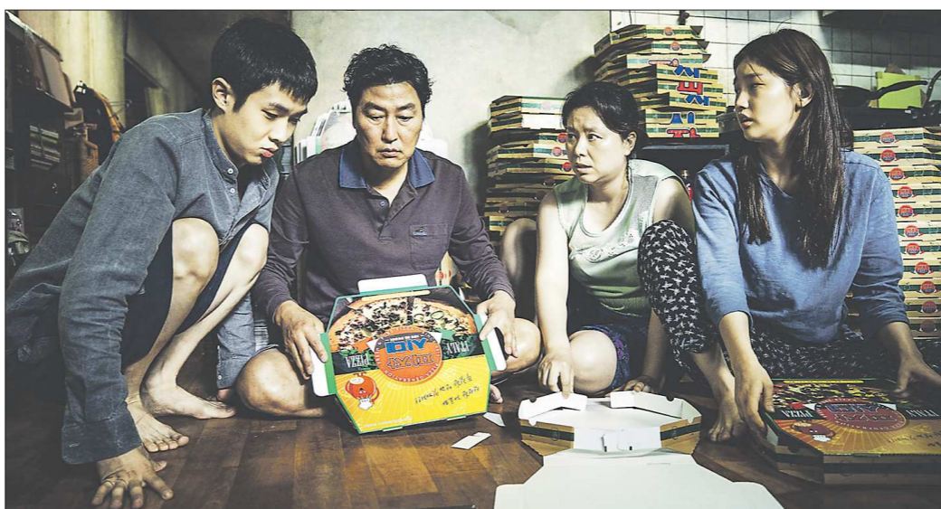
Главу бедной семьи сыграл известный корейский актёр Сон Кан-хо (второй слева), многократный номинант и обладатель «азиатского «Оскара» – награды Азиатской киноакадемии

Паки – явные художественные антагонисты семьи Ким. У них также двое детей, они невероятно богаты, беспечны, живут на широкой ноге в огромном доме. Но хитрый Ки Тхэжу в эту жизнь быстро влетает своих родственников. Обманывая доверчивую хозяйку, он пристраивает сестру учителем