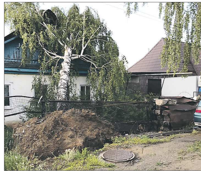
Ураганный ветер вырвал деревья с корнем, и они падали на дома

Из-за порывов на линии без электричества остались жители 274 домов, в 28 домовладений прекратили подачу газа. Специалисты ресурсоснабжающих организаций работали на пострадавших от стихии линиях до поздней ночи. За двое суток электроснабжение восстановлено, на время сдачи номера в печать работы аварийных бригад на газовых