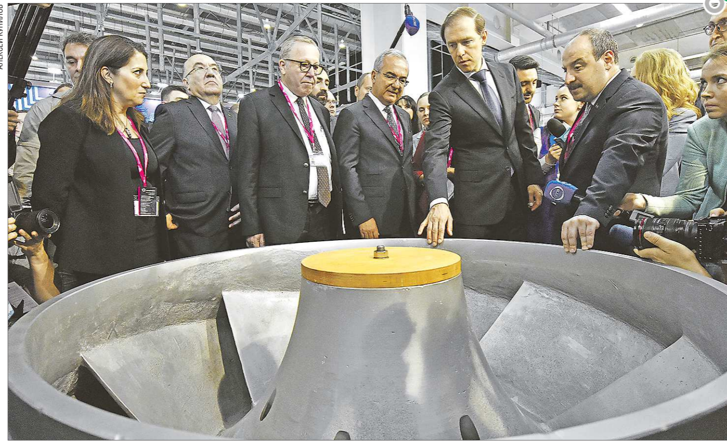
В этом году страной-партнёром ИННОПРОМА выступает Турция. На снимке: министр промышленности и технологий Турецкой Республики Мустафа Варанк (справа) знакомит с экспонатами стенда своей страны российского коллегу – министра промышленности и торговли РФ Дениса Мантурова (второй справа)