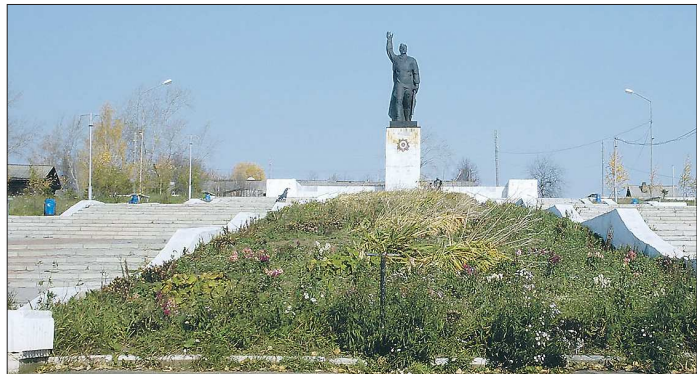
Сегодня в Верхней Туре живёт чуть более 9 тысяч человек