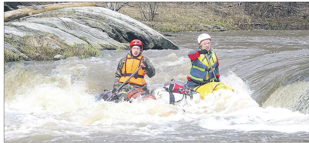
На Урале чаще сплавливаются на катамаранах (на фото), также популярны плоты, байдарки, каяки и рафты

Классическая «двоячка» — как раз Исеть, где есть и перекаты, и шиверы — мелководные участки с выступающими камнями и быстрым течением. На этой реке находится и очень красивый порог Ревун. И в этом месте в зависимости от расхода воды сложность определяется уже от третьей категории до пятой. Третья — это в межень, когда воды мало. А пятая — поلوводье, в такой период с лёгкостью закручивают четырёхместные катамараны... Самая сложная — «шестёрка», это уже Средняя Азия, либо при сильном паводке алтайские или саянские реки, когда по воде плывут деревья — жуткое зрелище. На Урале такого, конечно, нет.