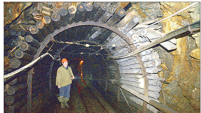
Лыготный стаж для подземного рабочего шахты — всего 10 лет, а вот общий трудовой должен быть больше — 20 лет

В 2018 году количество отказов в назначении досрочной пенсии для тех, кто занят на вредных условиях труда, в стране увеличилось и достигло 170,5 тысячи случаев. И хотя число таких отказов в общей массе невелико, людей такие факты настораживают. Возникает вопрос — почему? Многие связывают это с пенсионной реформой, ссылаясь на то, что в советское время никогда никаких отказов для работников вредных производств не было.