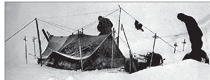
Делу тургруппы Дятлова уже много лет, но до сих пор непонятно, по какой причине они спешно покинули палатку на склонах горы Холат-Сялх

Уточняют и льготный стаж для назначения досрочной пенсии, а после определяют дату выхода на неё. Если человек уже не работает в организации, имеющие льготные рабочие места, либо у организации не заключено соглашение с ПФР, то можно обратиться в управление лично. Надо делать это заранее, за 12 месяцев, чтобы вовремя уточнить свой стаж. Кроме того, информация о страховом стаже и стаже, дающем право на досрочную пенсию, можно получить в личном кабинете гражданина на сайте ПФР. А если есть период работы, не учтённый в сведениях на индивидуальном лицевом счёте, он вправе обратиться в управление, в том числе записавшись на приём на сайте Пенсионного фонда.