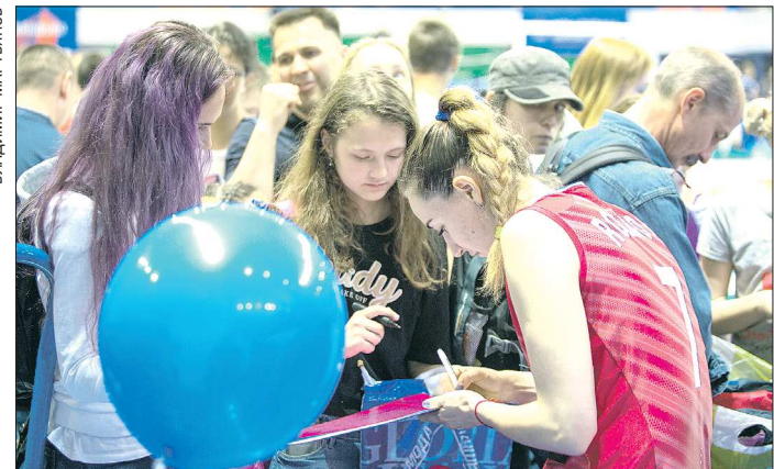
Несмотря на результат, любителей автографов было немало