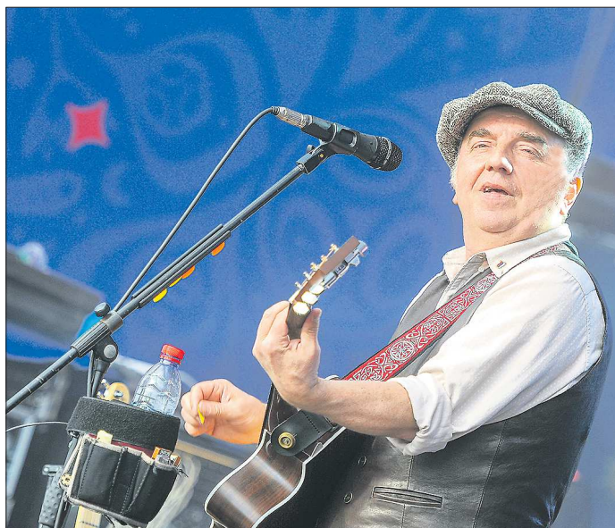
Ни один репортаж о матче чемпионата мира 1998 года Аргентина - Ямайка не может по своей популярности сравниться с песней Владимира Шахрина

Владимир Шахрин – явление уникальное. Его группа с вроде бы незамысловатым и в то же время немногим таинственным названием «Чайф» стала главным долгожителем свердловского рока.