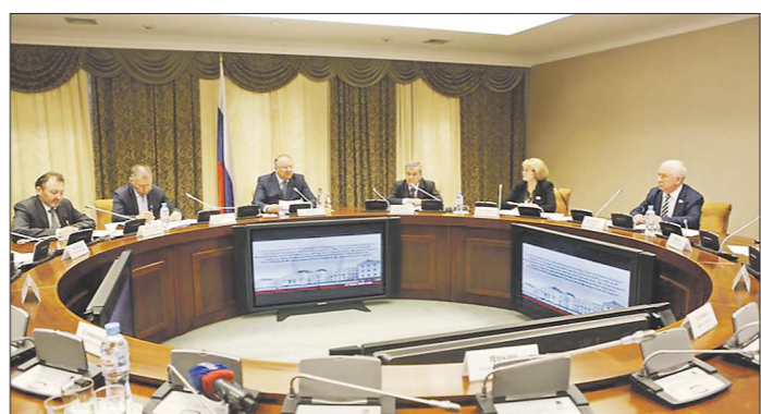
Заседание руководителей законодательных органов субъектов УрФО в полпредстве было посвящено реализации нацпроектов

Заседание Совета руководителей законодательных (представительных) органов субъек-