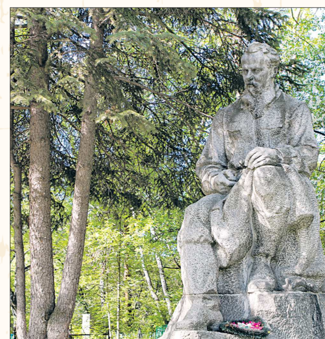
Этот всем известный памятник на могиле Бажова был установлен через 11 лет после смерти писателя