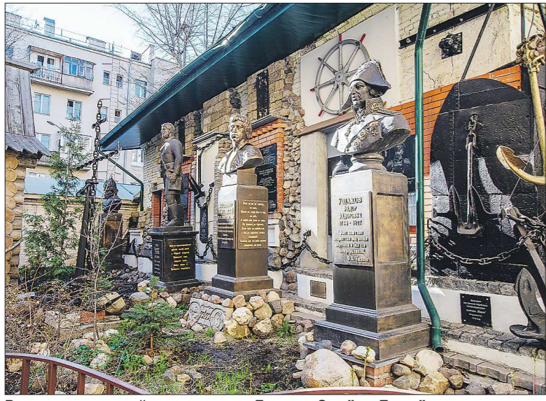
Вокруг мастерской – скульптуры Ермака, Семёна Дежнёва, Фёдора Ушакова, Сергея Радонежского, Павла Нахимова