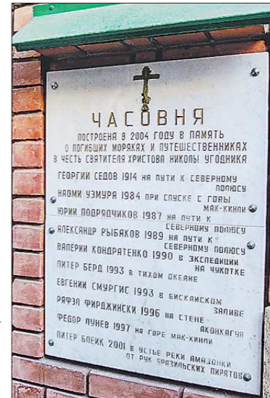
Каждый должен пройти свой путь. Вышла на свой духовный Эверест, и прощай! Горы к Южному и Северному полюсам. Фёдор Коннохов