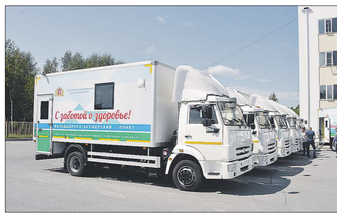
Всего в больницах области теперь 37 передвижных медицинских комплексов