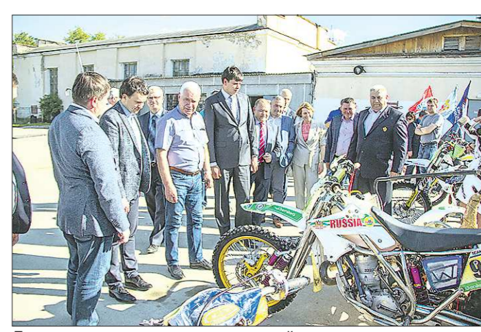
Депутатам показали не только ветхий стадион, но и технику, на которой каменские гонщики покоряют мировые вершины

– Следующая ближайшая цель – крытый стадион с искусственным льдом. Какова сейчас ситуация? – Решение о строительстве крытой арены в городе Первоуральске было принято в рамках выполнения поручения Президента Владимира Владимировича Путина о развитии русского хоккея. Губернатор Свердловской области Евгений Владимирович Куйвашов эту инициативу поддержал. На данный момент проведён конкурс, определены подрядчик на создание проектно-сметной документации, в ближайшее время на суд общественности будет представлен эскиз ледовой арены. Так что в будущем смотрим с оптимизмом.