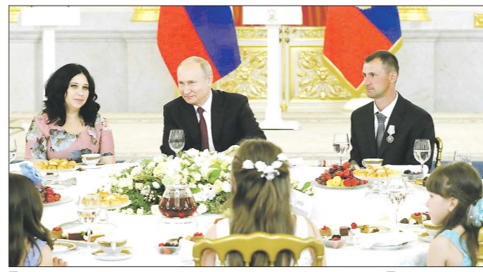
После награждения – чаепитие за одним столом с Президентом

– Воспитание детей стало делом всей нашей жизни. Уверен, что всё остальное подчиняется этой самой главной и крайне ответственной задаче. Её можно без преувеличения назвать миссией. Именно в многодетных семьях с малых лет закладывается ценность взаимопонимания и трудолюбия. Вырастая в окружении сестёр и братьев, под крылом любящих родителей, дети обретают способность сочувствовать и про-