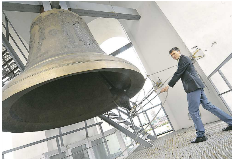
Колокол «Большой Златоуст» – второй по величине на Среднем Урале

Екатеринбургскую епархию знают в России как место с четвёртым по весу колоколом в стране. Он установлен в 30 километрах от Екатерин-