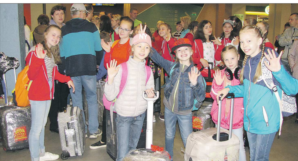
По субсидированным билетам дети могут улететь на отдых в Крым и Калининград

Льготный билет для детей от 10 до 17 лет включительно можно приобрести в билетных кассах, на официальном сайте ОАО «РЖД» и при помо-