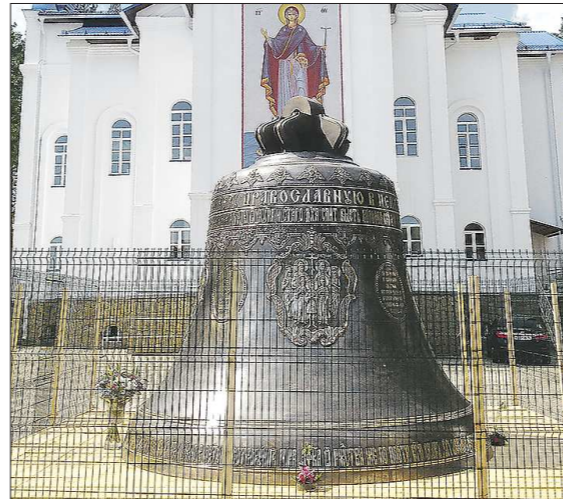
Колокол «Благовестник» в Среднеуральском женском монастыре – самый большой на Среднем Урале