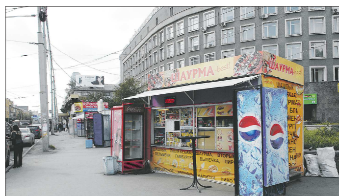
Вот так пять лет назад выглядел тротуар на перекрёстке улиц Малышева и Восточной. Сейчас там остались только киоски на остановочном комплексе

В этом году, по словам докладчика, в схеме размещения нестационарных объектов в уральской столице – 2 337 киосков, хотя фактически их на тысячу больше. При этом, если брать статистику по городу в целом, то он перенасыщен торговыми площадями: на тысячу жителей приходится 370 квадратных метров продовольственных торговых площадей (при нормативе минимальной обеспеченности – около 319 квадратных) и 1 106 непродовольственных (при нормативном минимуме – 613 квадратных). Но размещены они неравномерно: в центре – засилье, а