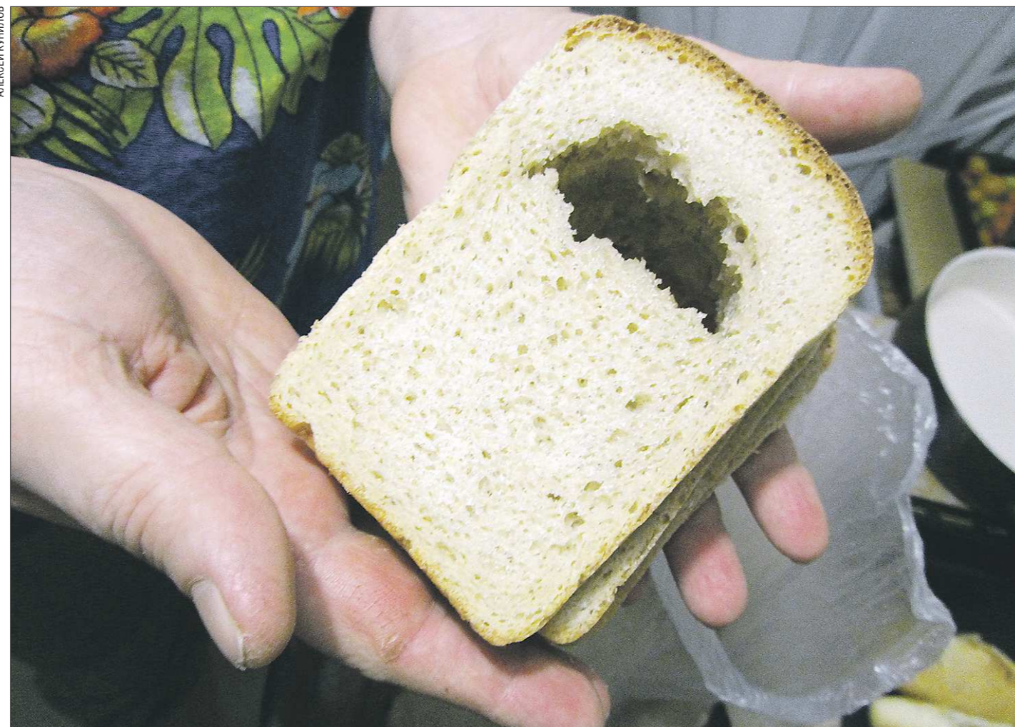
Один из признаков использования некачественного зерна и муки – превышение показателя пористости хлеба

По итогам первого квартала этого года управление Роспотребнадзора по Свердловской области проверило 7,4 тонны хлебобулочных и мучкомольно-крупяных изделий, забраковало и изъяло 2,3 тонны – 31 процент. Большая часть забракованного количества припала на муку. Вот и хлебопёки кивают на дефицит качественной муки в ответ на упреки россиян. Но при этом мучкомолы предлагают использовать в помольных партиях... фуражного зерна.