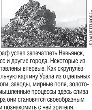
Адрес: Фотографический музей «Дом Метенкова» (Екатеринбург, ул. Карла Либкнехта, 36). С 24 апреля по 17 ноября.

В музее «Дом Метенкова» откроется выставка снимков, которые Вениамин Метенков привёз из путешествия по Уралу. На экспозиции можно будет увидеть коллекцию фотографических открыток Вениамина Метенкова и стеклянные негативы, идентичные оригинальным. Фотограф успел запечатлеть Невьянск, Верхотурье, Соликамск, Златоуст, Миасс и другие города. Некоторые из работ отреставрированы и будут представлены впервые. Как скульптурный летописец он воссоздал эмоциональную картину Урала из отдельных снимков. Строительство железной дороги, заводы, мирные поля, золотодобытчики на промысле – люди и промышленные процессы здесь сливаются в единый пульс жизни. Для автора они становятся своеобразным языком, способом обратиться к эпохе и познакомиться с ней зрителем.