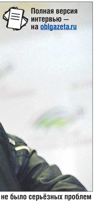
Полная версия интервью – на oblgazeta.ru

– В одном интервью Дмитрий Парфёнов сказал, что видит тебя в роли нападающего, который замыкает передачу. Но на деле это не всегда получается. У тебя свобода творчества на поле? – Он, наверное, имел в виду ситуацию, когда мы после подачи в штрафную перелетает всех игроков и оказывается на дальней штанге. Там я и должен находиться и замыкать. Перед игроками на установках у меня есть такая задача, но это не персональная рекомендация. Это, скорее, относится ко всем игрокам моей позиции. Мне над