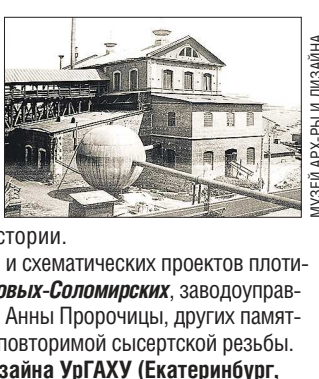
Выставка состоит из фотографий и схематических проектов плотин на реке Сысерти, завода Турчанинов-Соломыркинских , заводоуправления, храма Симеона Богопримца и Анны Пророчицы, других памятников зодчества, а также образцов неповторимой сысертской резьбы.