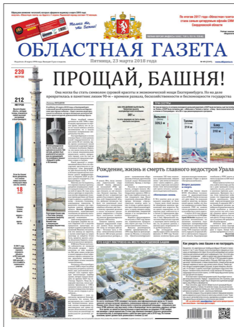
«Лучший информационный пакет»

КСТАТИ. «Областная газета» побеждает в конкурсе «Лучший дизайн СМИ» второй год подряд. В прошлом году номинации было больше, чем сейчас, и «ОГ» тогда взяла четыре награды.