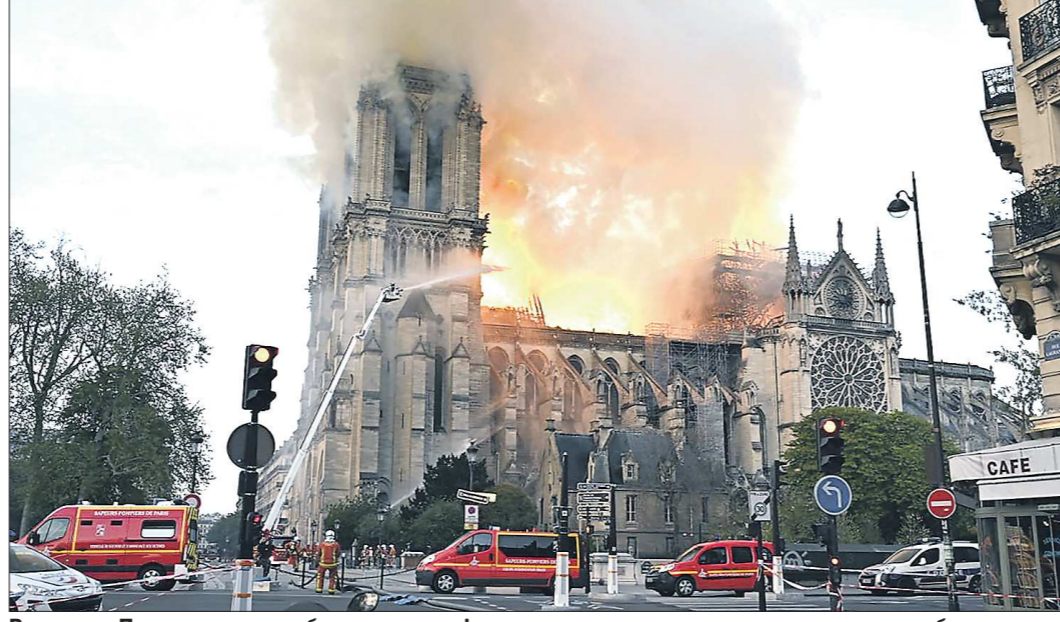
Владимир Путин выразил соболезнования французскому народу в связи с пожаром в соборе Парижской Богоматери и предложил помощь лучших российских специалистов в его реставрации

Многим известно это крылатое выражение, которое приписывают Генриху Наваррскому. Слова эти лидер французских протестантов якобы прокричал после того, как в 1593 году принял католическую веру, чтобы стать королём Франции и основателем династии Бурбонов. Фраза стала крылатой: