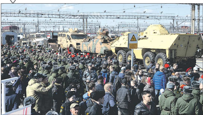
Встретить необычный поезд на перроне вокзала Екатеринбург-Пассажирский пришли тысячи горожан и военнослужащих Екатеринбургского гарнизона