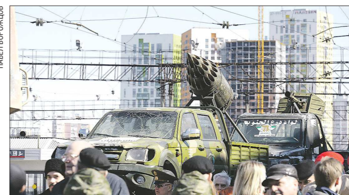
«Джихад-мобили» боевиков привлекли особое внимание посетителей необычной выставки