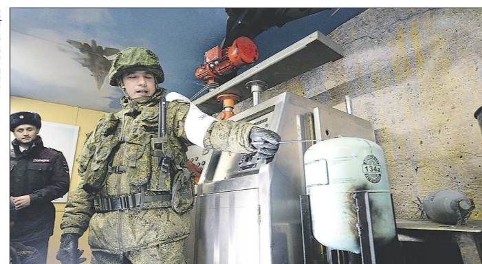
В одном из вагонов вместе с другими изъятиями у террористов боеприпасами выставлена самодельная химическая бомба