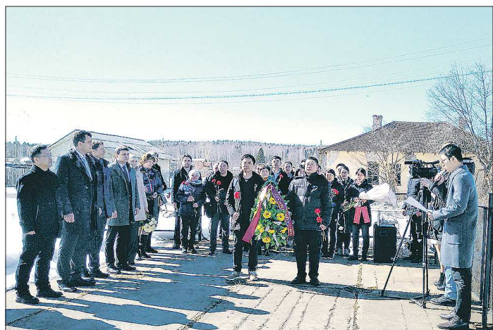
Китайские гости и свердловчане возложили цветы к памятнику на братской могиле

5 апреля в Китае отмечают цинмин - день поминовения усопших. Генеральное консульство КНР в Екатеринбурге организовало посещение китайской делегацией мемориала на станции Выя в Нижнетуринском городском округе. Там 101 год назад в сражении с белоказаками погиб почти весь красный китайский полк и его героический командир Жэнь Фучэнь.