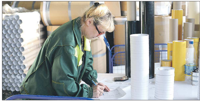
За первый квартал 2019 года услугами фонда поддержки предпринимательства воспользовались уже 176 компаний