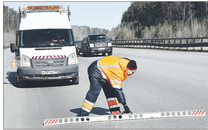
Отремонтированные в 2017-2018 годах участки Серовского тракта и сейчас в идеальном состоянии

Заметим, что новый нацпроект создавался не на пустом месте, а стал продолжением приоритетного проекта «Безопасные и качественные дороги», в котором Средний Урал активно участвовал на протяжении последних двух лет. В прошлом году, например, на его реализацию только на территории Екатеринбургской агломерации было направлено 1,8 миллиарда рублей: один миллиард – из областного бюджета и 800 миллионов – из федерального. В течение года за счёт этих средств дорожники отремонтировали в общей сложности 108 километров дорог, из них 32 километра улично-дорожной сети областного центра и 76 километров региональных автодорог. А в 2019 году к проекту присоединилась уже и Нижнетагильская агломерация, которая получит из федерального бюджета на его реализацию 500 миллионов рублей.