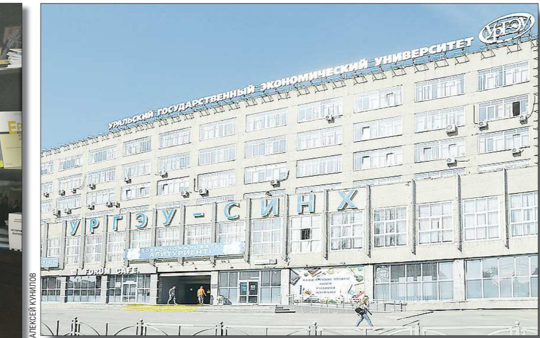
В УрГЭУ издаются четыре научных журнала и несколько корпоративных изданий

— Создана научно-исследовательская лаборатория и Единый лабораторный комплекс университета. Здесь можно определить пищевую ценность, электрические и химические показатели, провести микроскопический анализ продуктов. В первую очередь лаборатория обеспечивает учебный процесс, также в ней работают