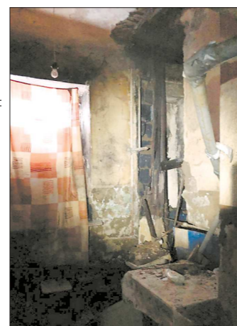
Несмотря на то что из программы капремонта ежегодно

грамму капремонта тоже не включены. Для выполнения таких видов работ необходимо временно отселить людей. За эксплуатацию жилфонда отвечает управляющая компа-