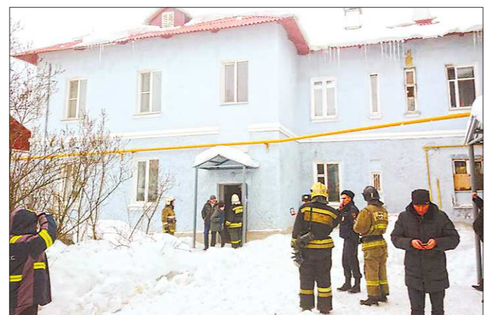
По предварительным оценкам, причиной разрушения стен могли стать повреждённые теплосети

Как подтвердили «Облазете» в Фонде капремонта области, работы в доме в 2017 году проводила компания «Промстройсервис» - обновили фасад, оснастку, крышу, системы холодного водоснабжения, водоотведения, теплоснабжения.