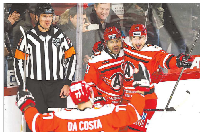
«Автомобилист» стал недосягаем для соперников по Восточной конференции за три матча до конца регулярного чемпионата

которые предстоит провести «Барысу» в регулярном чемпионате, такое отставание не отыгрывается: за победу клуб может получить максимум два очка. Вообще, в этом году борьба на Востоке КХЛ разворачивается нешуточной. Долгое время в лидерах лиги находились «Автомобилист», «Авангард» и «Ак Барс», но ближе к концу чемпионата здорово прибавил «Барыс». Хоккеисты из Казахстана в последних 20 матчах одержали 12 побед, сломив сопротивление ЦСКА, «Салавата Юлаева», «Металлурга» и «Йокерита». И до последнего момента клуб из Астаны боролся за лидерство на Востоке. Теперь «Автомобилист», обеспечив себе первую строчку в Восточной конференции, может полностью сконцентри-