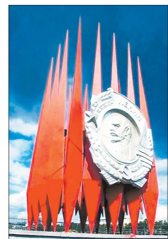
Краснознамённую группу в Свердловске установили в 1974 году