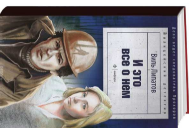
«И ЭТО ВСЁ О НЁМ» Виль Липатов

В основу романа положена история о подпольной молодежной организации, которая действовала в Краснодаре во время Великой Отечественной войны. Олег Кошевой , Любовь Шевцова , Ульяна Промова , Сергей Тюленин , Иван Заминин – все эти герои были спящими фиделерами с реальными людьми. Это, пожалуй, самое известное произведение из нашего списка, но тем не менее мы думаем, что читали его нечасто из вас.