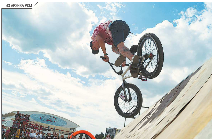
Сегодня к РСМ присоединяются молодые люди из разных городов. Ребята выбирают яркую жизнь. Например, в рамках проекта «Экстриму – Да, экстремизму – Нет» они продвигают брейк, стритрейсинг и другие активности

Какие альтернативы комсомолу существуют в маленьких городах