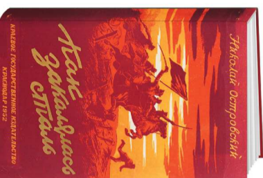
«КАК ЗАКАЛЯЛАСЬ СТАЛЬ» Николай Островский