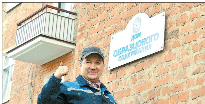
Табличку с почётным знаком сразу же повесили на фасад пятиэтажки – в пример другим

В образцово-показательный двор Константин Цицин пришел вместе с главой минЖКХ области Николаем Смирновым и мэром Екатеринбурга Александром Высокинским . Дом действительно стал поводом для гордости жильцов. Как сообщили в пресс-службе градминистрации, в этом году в рамках региональных и муниципальных программ здесь провели капитальный ремонт и благоустроили дворовую территорию. Непосредственное участие в работе, в том числе и финансовое, приняли жители. Общие затраты составили почти 10 миллионов рублей, из них около 500