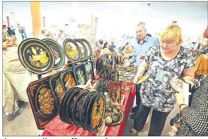
Фестиваль «Иван-да-Марья» собирает мастеров не только с Урала, но и с других регионов России