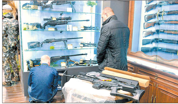
В оружейных магазинах сейчас можно выбрать стволы на любой вкус

Но вернемся к вопросу об охотничьем билете. В эти дни в Екатеринбурге проходит первый трофейный форум, и вопрос о керченских событиях, конечно, возник. На выездном