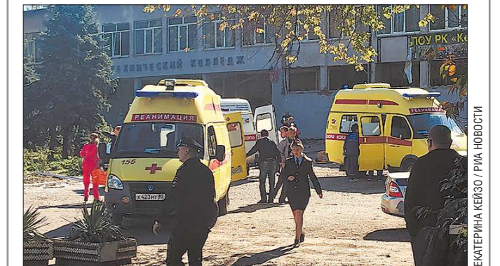
У Политехнического колледжа в Керчи, в котором произошло убийство

Президент поручил Минздраву России, МЧС России, спасательным службам принять экстренные меры по оказанию помощи пострадавшим, при необходимости обеспечить их срочную транспортировку в ведущие лечебные учреждения России в Москве и других городах. В Крыму с 18 октября объявлен трёхдневный траур.