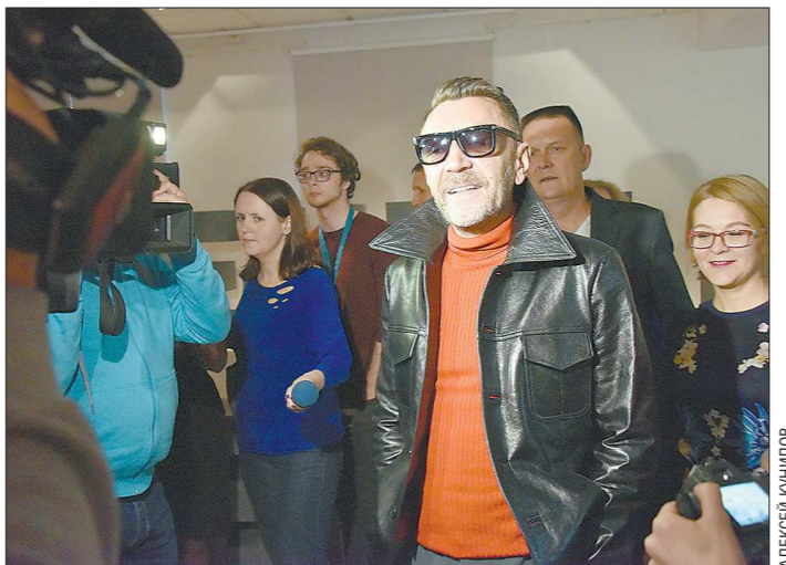
Сергей Шнуров пришёл на выставку, и, как в его известной песне, сразу стало понятно, кто на ней главный экспонат