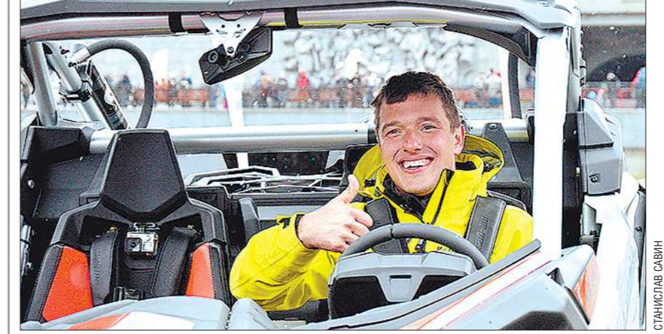
Сергей Карякин в квадроцикле

Отметим, что подобный фестиваль прошёл в уральской столице впервые. Он был посвящён поддержке заявки Екатеринбурга на проведение выставки ЭКСПО-2025