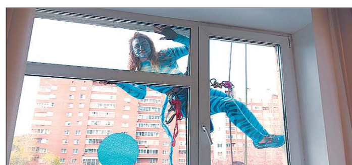
Все супергерои имеют удостоверения для работы на высоте

Найденные в местах боев личные вещи бойцов отряда «Пепел» оформили в передвижную выставку и теперь показывает их на уроках по истории сверстникам.