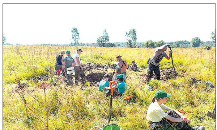
Отряд «Держава» трудился две недели в августе в местах боев 371-й Уральской дивизии