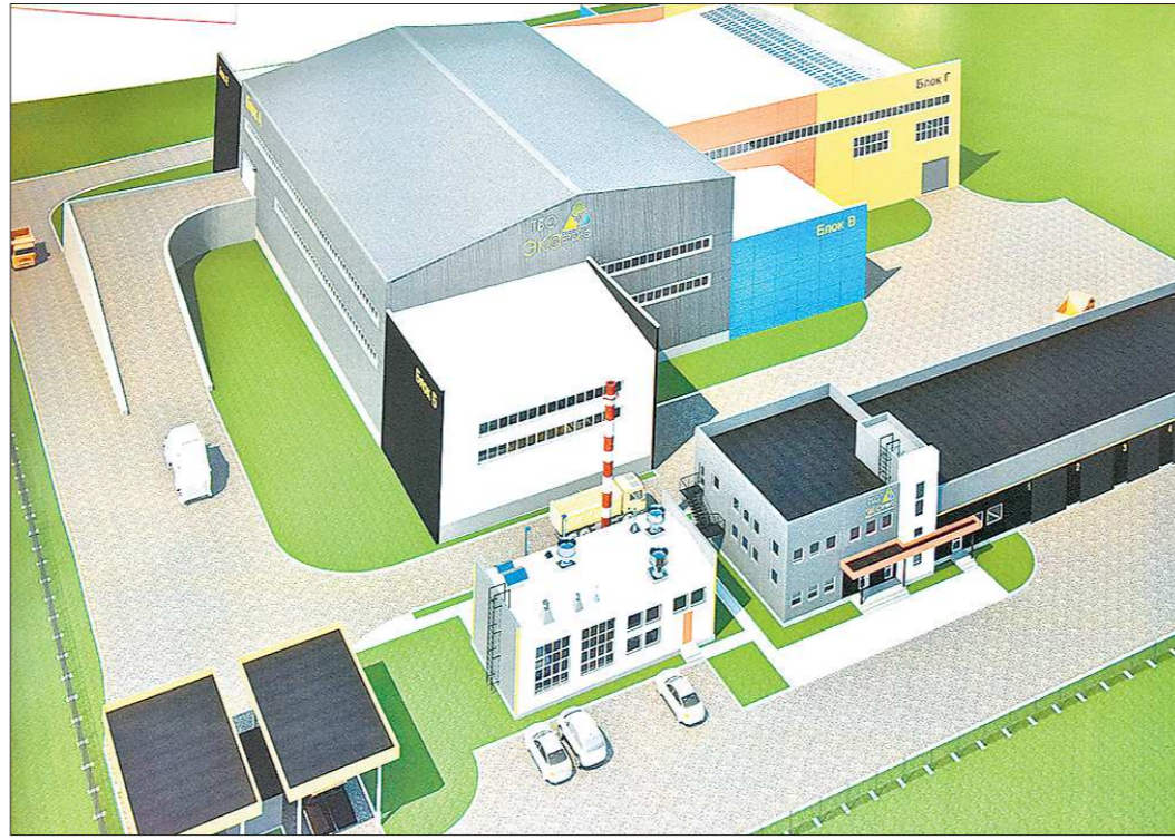
Так будет выглядеть завод по переработке ТБО в Первоуральске после реконструкции

Завод будет работать по европейским технологиям, мы закупает новую автоматизированную линию, оборудование подбирает немецкая компания «EWB Sorting Engineering UG». Появятся оптические сепараторы, которые без участия человека будут отбирать из общего мусорного потока отходы, пригодные для переработки, – сказал Сергей Николаевич. Принцип действия оборудования – в том, что оно сканирует материалы посредством чувствительных сенсоров и разделяет фракции с высокой степенью точности.