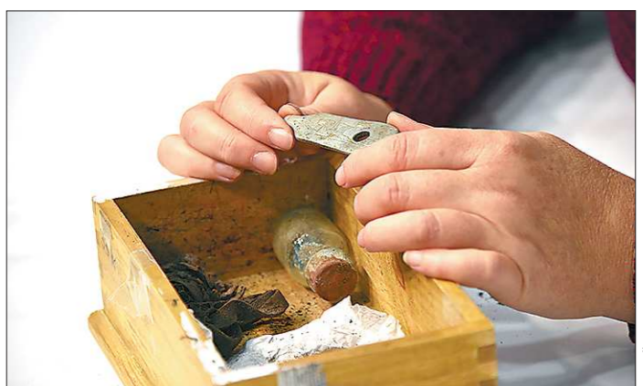
На части вилки, найденной отрядом «Пепел» в местах боев Великой Отечественной войны, можно прочитать только имя солдата