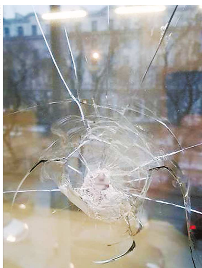
Офис УК «Лига ЖКХ» обстреляли в ноябре 2017 года, в возбуждении уголовного дела отказали

Пострадавшие в «коммунальных войнах» впервые собрались на круглом столе в редакции «Областной газеты»