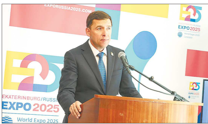
Евгений Куйвашев: «Свердловская область – это Россия в миниатюре»

Евгений Куйвашев рассказал также о вкладе Свердловской области в движение клубов ЮНЕСКО на территории России. Он напомнил, что первый клуб, созданный для продвижения принципов и идеалов ЮНЕСКО, был основан в СССР в 1987 году именно в нашем регионе. За прошедшие с тех пор годы Урало-Сибирская федерация клубов ЮНЕСКО