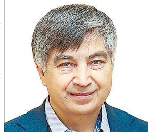
ПРЕСС-СЛУЖБА ДВОРЦА МОЛОДЕЖИ

Председатель жюри Всероссийской олимпиады школьников по математике, доцент Московского физико-технического института рассказал, зачем школьникам нужны интеллектуальные состязания.