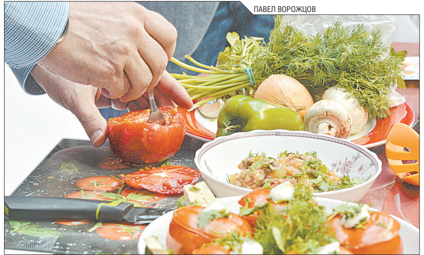
Питание – это дело привычки. Если в вашей семье едят полезную пищу, вы тоже скорее всего будете её любить

Когда мои подопечные хотят сорваться, я всегда спрашиваю у них: «Кого вы хотите видеть в зеркале, красивого стройного человека или полного, со складочками?» Чаще всего наше желание съест лишнее – это психологический голод. Удовольствие будет коротким. Но если совсем не смогу, я разрешаю съест несколько долек чёрного шоколада или овощной салатик.