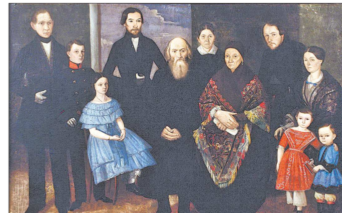
Прославляя заказчицу, художники XIX века не думали о личном самоутверждении (недаром среди провинциальных портретов так много анонимных работ). И в данном случае главным был образ незыблемой константы общества – большой семьи, со многими поколениями