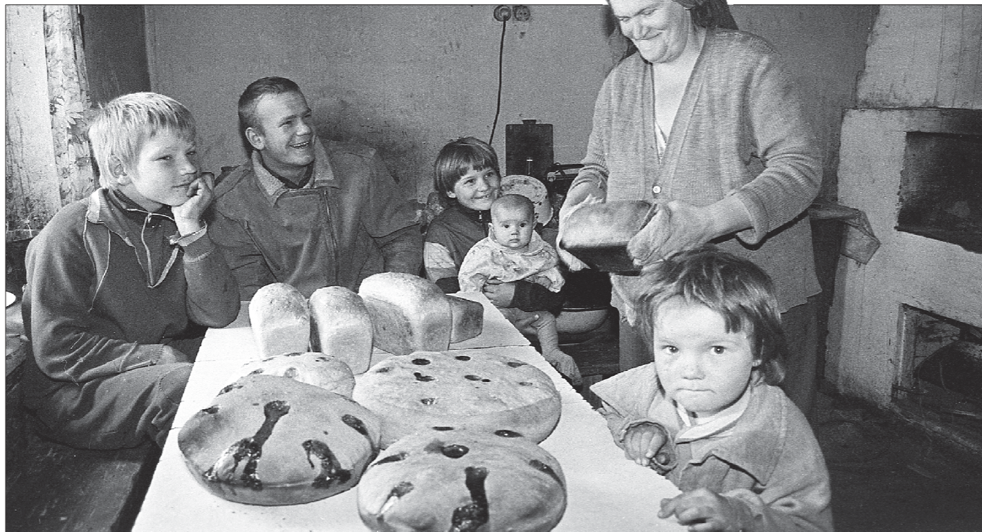
Снимок, случайно сделанный в конце прошлого столетия фотокорреспондентом «ОГ» на станции «Михайловский завод», не раз оказывался в центре внимания на фотоконкурсах и выставках. Что останавливало наш взгляд?

Да, существует понятие «глава семьи», и в этом качестве, конечно же, предполагается мужчина, но я убежден: