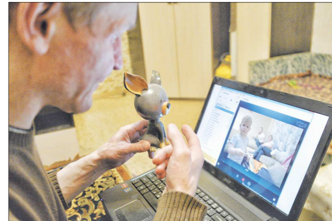
Досадно, когда по скайпу общаются с внуками, живущими в том же городе. Но сегодня, когда жизнь разматала близких людей не только по разным городам, но и странам, скайп порой – единственная палочка-выручалочка

Серьёзные нравственные изменения в обществе, которые редакция планирует обсуждать в новой рубрике, – дискуссионный. «ОГ» Пишите на адрес: «Областная газета», 620004, Екатеринбург, ул. Мальшева, 101; или на e-mail: klepikova@oblgazeta.ru Хотелось бы знать и мнения читателей «по поводу».