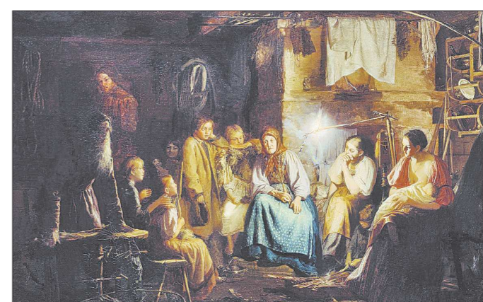
Истари в России велика была в воспитании детей роль бабушек и дедушек: они не только присматривали за детьми, но и передавали им полезные знания. Часто происходило это через сказки...