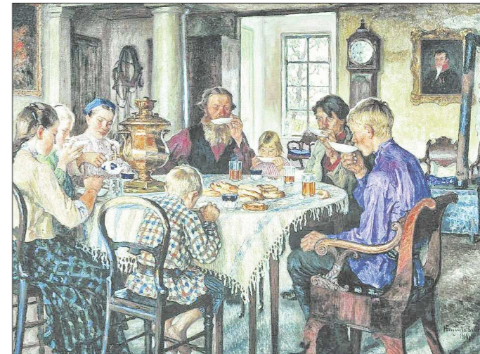
Богданов-Бельский, «незаконнорожденный сын бедной бабылки» (слова самого художника), создал немало посвящённых семье жанровых полотен, от которых, считают специалисты, исходит сама доброта