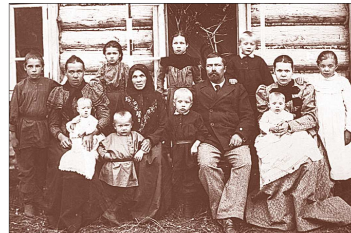
«Кормчая книга», свод церковных правил, устанавливала: «Грешно пытаться решать за Бога, кому появляться на свет». Большие семьи, когда под одной крышей жили четыре поколения, имели к тому не только экономические, но и нравственные причины