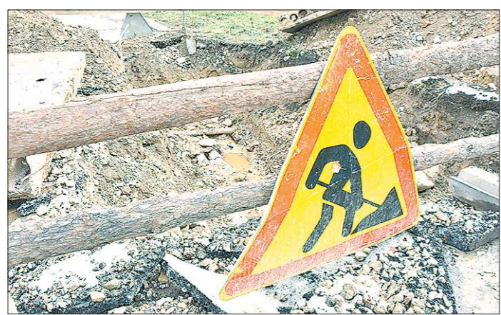
В текущем отопительном сезоне в области произошло 182 коммунальные аварии