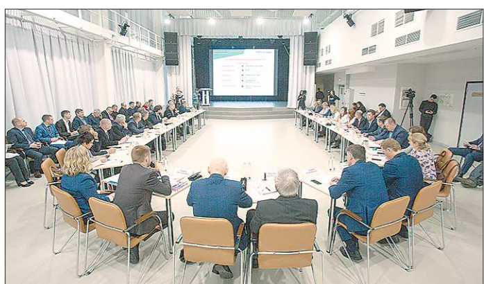
На презентацию инвестпотенциала Алапаевска собралось столько гостей, что понадобились дополнительные стулья