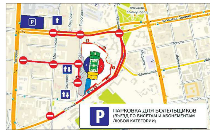
Для болельщиков будут действовать две городские парковки: на площади 1905 года и на перекрёстке Токарей и Татищевой. Везд на эти стоянки будет производиться при предъявлении билета любой категории на екатеринбургский стадион

Сейчас пишу книгу о свердловском хоккее, который, являясь несомненно, лучше меня никто не знает. Ещё одна моя тема — это маршал Жуков . Если захватит сил и времени напишу о генерале Фитине — создателе уральского динамовского спорта. В общем, планов много.