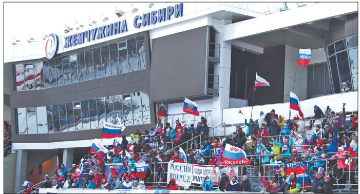
«Жемчужина Сибири» в Тюмени должна была принимать ЧМ-2021 по биатлону