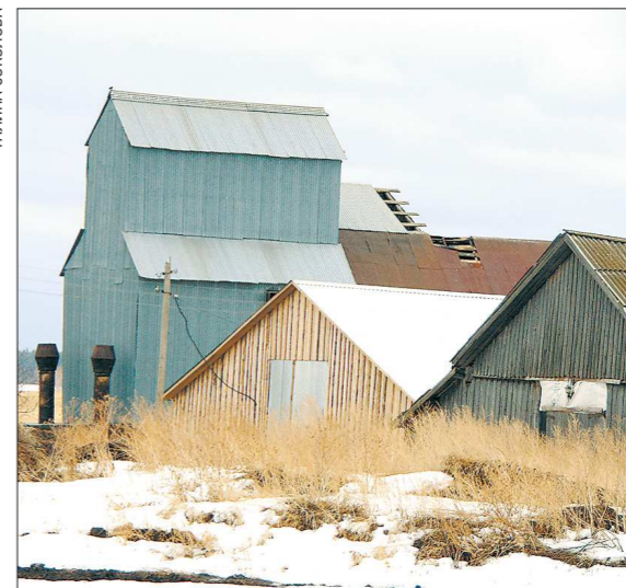
В 90-е годы совхоз стал одним из немногих предприятий, которые не только устояли, но и нарастили производство

Зерносклад на 700 тонн у шумихинцев тоже с иголкой. Построили его уже без вмешательства главы государства. Статус госпредприятия никаких преференций совхозу не даёт. Субсидии на молоко они получают точно такие же, что и частники, на зарплату работников, стройки, технику зарабатывают сами. В финансовых делах статус только добавляет проблем. Ни одной покупки нельзя сделать без торгов, ни од-