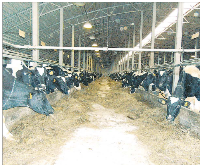
У каждой коровы на ферме — своя кличка. Например, здесь подрастают Прибыль, Валюта и Цена

Верхнетуринский, Лайский, Висимский совхозы — от них не осталось и следа ещё в перестроечные годы. Остальные хозяйства дожили до капиталистической поры и акционировались. Один совхозов вскоре вообще исчезли, другие либо превратились в небольшие крестьянско-фермерские хозяйства,