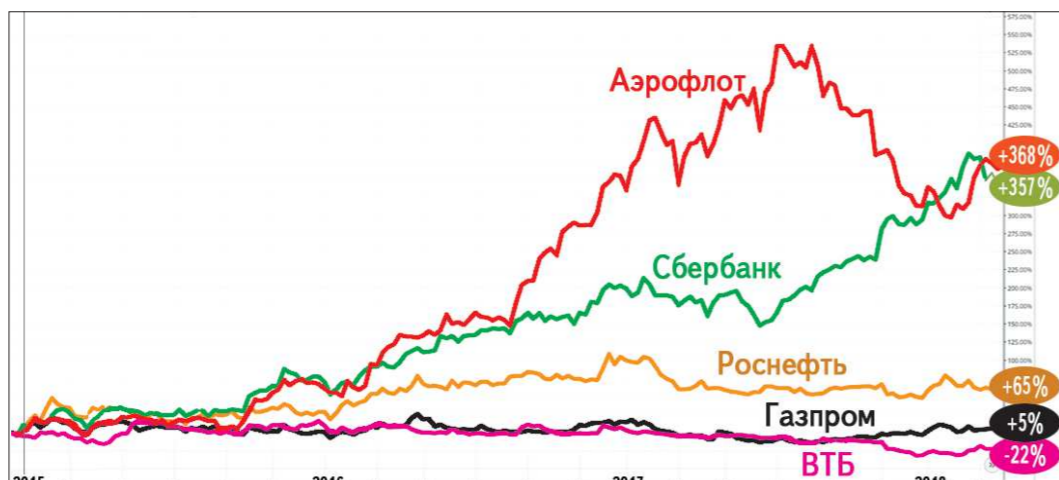
Те, кто в начале 2015 года купил акции Сбербанка, за минувшие годы утроили размер своего депозита

В конце 2014 года и в начале 2015 года многие крупные компании стоили одинаково дешево. Рынок будоражило, доллар рос. На Сбербанк в это время началась информационная атака, после чего вкладчики стали массово закрывать счета. А после того, как тогдашний президент США Барак Обама сделал заявление в Варшаве о санкциях в отношении Газпрома, его котировки моментально обвалились со 130 до 113 рублей. В будущее российского рынка акций тогда никто не верил. Но те, кто в тот момент приобрёл, например, акции Сбербанка, всего за несколько лет утроили размер своего депозита.