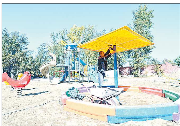
К 1 ноября все запланированные объекты должны сдать