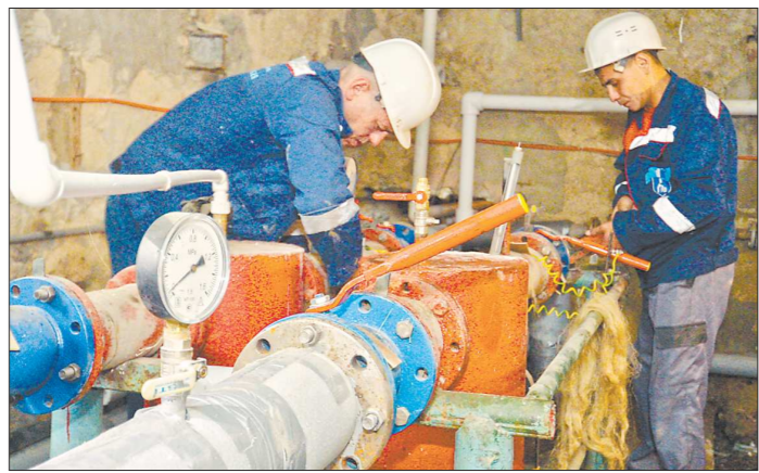
Большинство многоквартирных домов Екатеринбурга оборудованы только общедомовыми приборами учёта тепла

На Средний Урал пришла долгожданная весна. Одной из её примет в наших городах в прошлые годы были повсеместно открываемые настежь жилыми многоквартирных домов форточки и фрамуги окон.