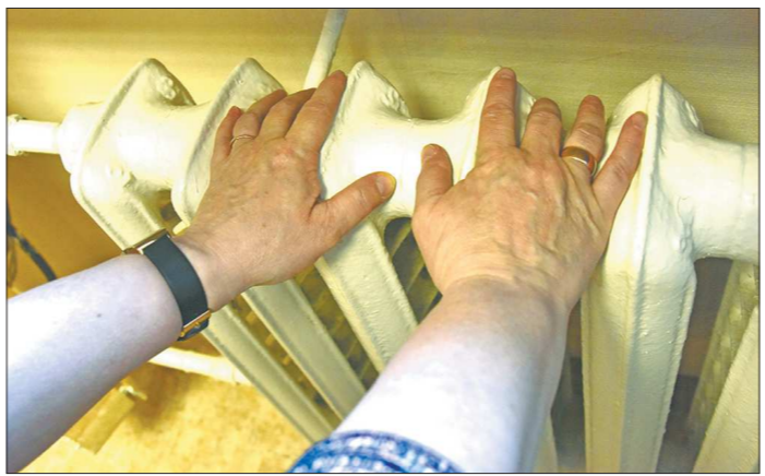
Когда за окнами теплеет, платить за отопление мы должны меньше

месячно удерживали фиксированную сумму за отопление — 2331,82 рубля. Зато в двух последующих сезонах суммы уже разные.