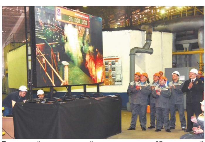
Показанный на мультимедийном экране выпуск 35-миллионной тонны труб был встречен шквалом оваций и заводским гудком

По его словам, Синарский трубный завод обеспечивает промышленную безопасность нашей страны. Ведь предприятие ориентировано на выпуск труб именно для отечественной экономики и обеспечивает ими восемь отраслей экономики.