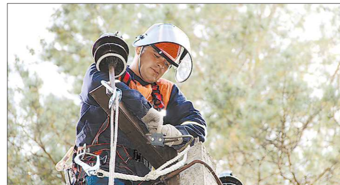
Раньше компания «МРСК Урала» отвечала за передачу электричества, теперь будет ещё и вести расчёты с потребителями

составляла порядка 850 миллионов рублей. Поставщики электроэнергии неоднократно обращались в арбитраж с требованием признать сбытовую компанию банкротом.