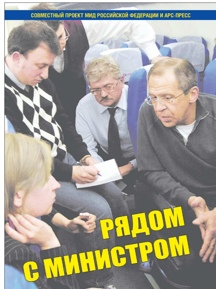
Буклет выпущен форматом А4, в нём 56 страниц

Сборник статей «Рядом с министром», опубликованных в региональных СМИ по итогам официальных визитов министра иностранных дел Российской Федерации Сергея Лаврова, представил накануне на Экспертном совете по СМИ в Министерстве связи и массовых коммуникаций России главный редактор «Областной газеты» Дмитрий Полянин.