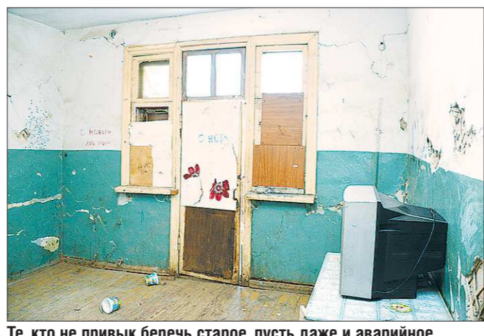
Те, кто не привык беречь старое, пусть даже и аварийное жильё, с трудом могут заставить себя поддерживать чистоту и порядок в новых домах