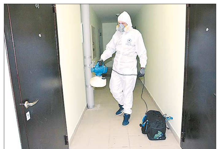
В шалинской новостройке уже провели одну обработку от клопов, но скоро она опять может понадобиться

В соответствии с Федеральным законом от 03.11.2006 № 174-ФЗ «Об автономных учреждениях» и постановлением Правительства Свердловской области от 30.01.2009 № 64-ПП «Об утверждении форм отчётов о деятельности государственного автономного учреждения Свердловской области и об использовании закрепленного за ним имущества» ГАУ «Каменск-Уральский ПНИ» публикует отчёт о результатах деятельности государственного автономного учреждения и об использовании закрепленного за ним государственного имущества за 2017 г. на портале www.pravo.gov66.ru в разделе: «Официальная информация юридических лиц».