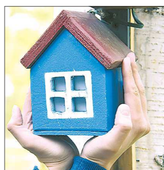
Не все жильцы при новоселье осознали, что судьба их нового дома — тоже в их руках

Но главная проблема домов, построенных для граждан льготных категорий — долги за коммунальные услуги. Например, в Качканаре, как только был построен дом для детей-сирот, начались проблемы по оплате. Отказывались платить каждый третий.