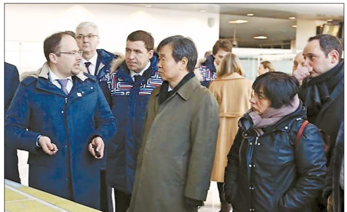
Сразу после прилёта в Екатеринбург председатель исполнительного комитета МБВ Джай-чун Чой (в центре) и другие члены инспекционной комиссии познакомились с инфраструктурой аэропорта Кольцово

Часть членов инспекционной комиссии была в Екатеринбурге пять лет назад, когда город претендовал на проведение ЭКСПО-2020. Сегодня эти люди смогли убедиться, что значительный процент того, что тогда было обещано, уже сделано. Это обновлённый аэропорт, дороги, гостиницы, стадион и многие другие объекты инфраструк-