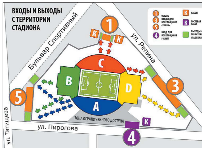
Болельщики «Урала» смогут зайти на территорию стадиона через входные группы 1, 3 и 5

Что ж, какие из 20 заявок получат средства, узнаем уже в следующем месяце.