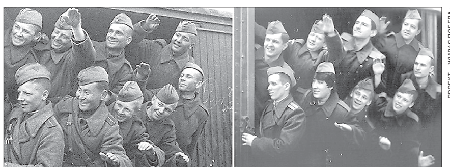
Наши современники в образе воинов Уральского добровольческого танкового корпуса, отправляющихся на фронт. Первый снимок был сделан неизвестным автором в 1943 году.

их бабушек и дедушек. Да, для этого необходима одежда тех времён, грим, реквизит, но это уже — задача организаторов.