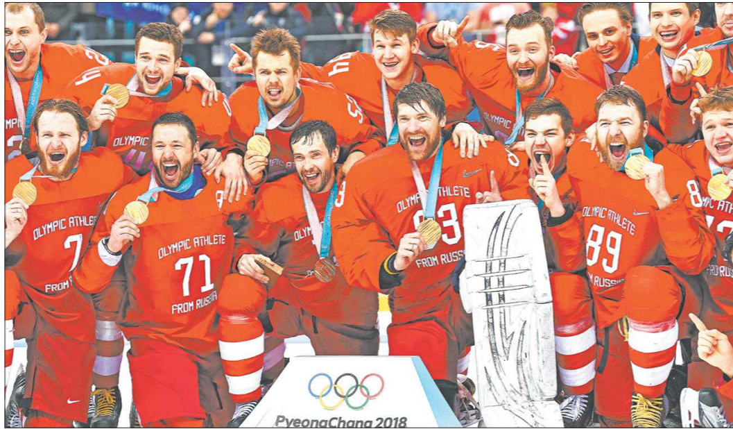
Для капитана сборной Павла Давыдова (в первом ряду третий слева) эта была пятая Олимпиада. Теперь его официально приняли в так называемый «Тройной золотой клуб»: туда попадают хоккеисты, победившие на Олимпийских играх, чемпионате мира и выигравшие Кубок Стэнли