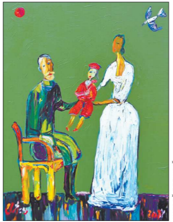
Андрей Елецкий. Наследник. Холст, масло

Особое внимание стоит обратить на Кирилла Глазгына и его авторскую коллекцию ювелирных украшений «Чёрный квадрат», посвящённую 100-летию выставки «10» (где впервые появилась самая известная картина Казимира Ма-