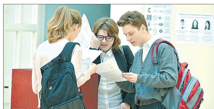
Проголосовать на участках могли молодые люди в возрасте от 14 до 30 лет. Но в основном пришли школьники и студенты

Напомним, молодёжный парламент дублирует структуру Заксобрания региона и состоит из 50 депутатов: половина избирается по одномандатным округам, вторая — по спи-