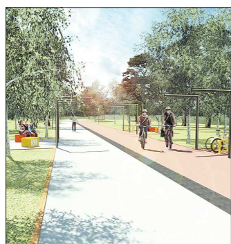
В парке появятся 7,7 километра велосипедных дорожек