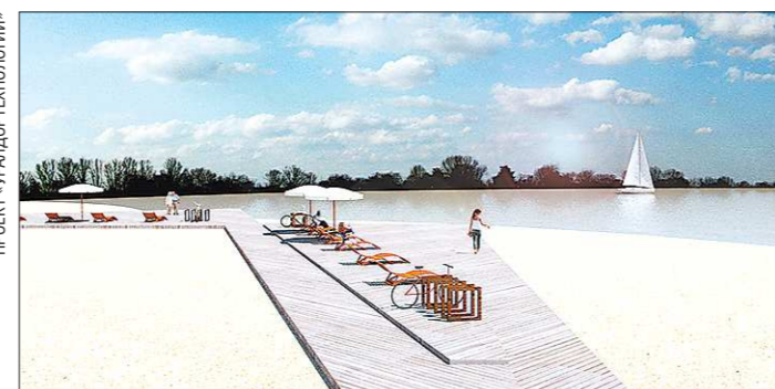
На пляжных зонах сделают насыпи из песка и установят шезлонги

— На территории часто можно обнаружить кучи мусора, идёт разрушение растительности. Обустройство парка выполнено ещё в 1980-е годы — оно морально и физически устарело. Разработчики предлагают построить 7,7 километра