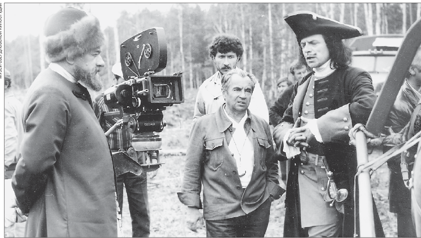
Эпизод съёмок фильма режиссёра Ярополка Лапшина «Демидовы» (1983 год)

От редакции: мы специально не вынесли на первую полосу материал об открывающихся сегодня зимних Играх в Пхёнчхане. Это — наша позиция